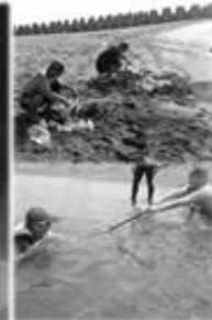
中華昆蟲水中運動協會 關山竹水域環境安全教育訓練委員會