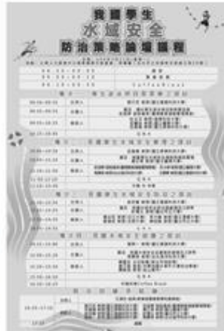
中華昆蟲水中運動協會 關山竹水域環境安全教育訓練委員會