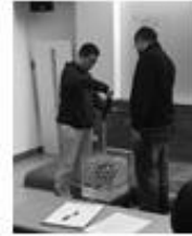
中華昆蟲水中運動協會 關山竹水域環境安全教育訓練委員會